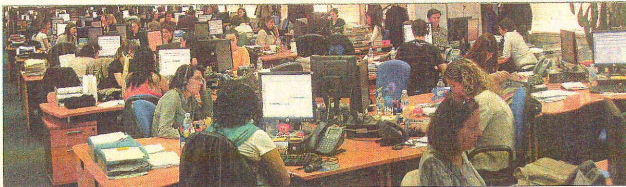
Oficinas de la multinacional sueca Intrum Justitia en España.